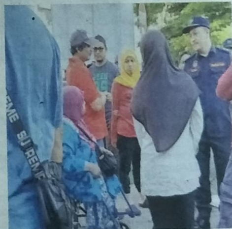
Para peniaga kecil ketika dimaklumkan oleh anggota penguatkuasa MBSA supaya mereka menghentikan operasi perniagaan bermula 6 Mei lalu.

"Keadaan jalan sesak menyebabkan aliran trafik tersekat. MBSA terima banyak aduan berhubung isu kesesakan di kawasan tersebut," katanya.