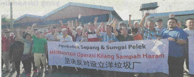
SEBAHAGIAN daripada penduduk sekitar Sungai Pelek membuat demonstrasi aman membantah operasi kilang memproses sisa plastik di Sepang semalam.