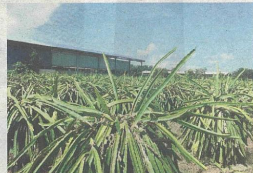
HASIL buah naga didakwa menurun secara mendadak ekoran pencemaran udara yang disebabkan oleh kilang plastik di Sungai Pelek.

SE PAANG - Seramai 12,000 penduduk daripada lima buah kampung di sini mendesak pihak berkuasa mengambil tindakan ke atas sebuah kilang memproses sisa plastik kerana sudah tidak tahan dengan bau busuk yang didakwa menjejaskan kesihatan, alam sekitar dan tanaman mereka.