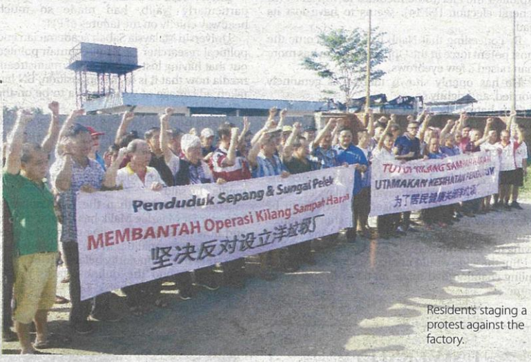
Residents staging a protest against the factory.

"With the Visit Malaysia 2020 campaign next year, how will tourists react when they witness the high pollution and toxic fumes here? We have had enough of this and we want the operations to stop altogether for good," he said.