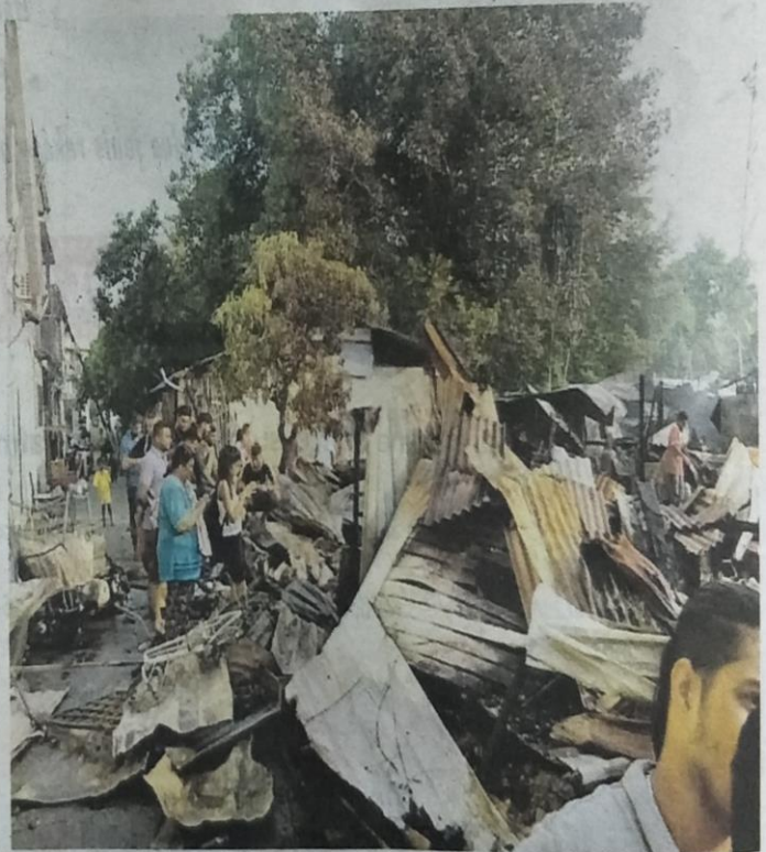
Orang ramai melihat rumah-rumah yang terbakar di Taman Pandan Jaya kelmarin.

“Jabatan Kebajikan Masyarakat mengambil maklumat kesemua mangsa untuk tindakan lanjut,” katanya.