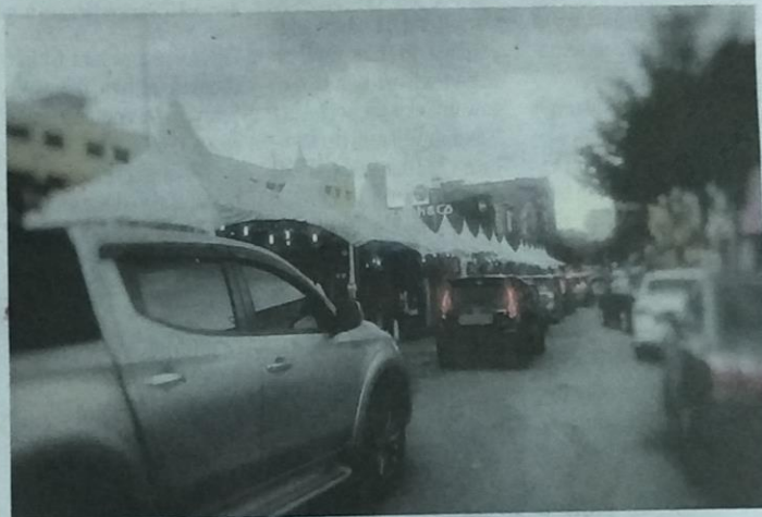
Kawasan di Seksyen 7 dipenuhi khemah jualan yang dipasang di tepi jalan dan turut menyebabkan kesesakan lalu lintas.

Arahan henti operasi Sementara itu, MBSA